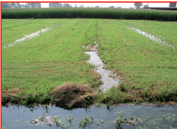
La marcita è un particolare tipo di prato stabile irriguo, purtroppo oggi sempre più raro, anticamente congegnato per ottenere abbondanti produzioni di foraggio durante tutte le stagioni. Lungo il percorso ciclabile delle Città Murate è ancora possibile vederne una presso Cascina Camozza.