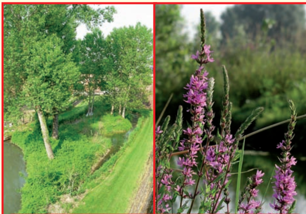
La lanca del Becco è una piccola zona umida, al margine del colatore Serio morto, recentemente oggetto di interventi di riqualificazione: nell'area si possono osservare le più comuni specie vegetali di questo tipo di habitat.