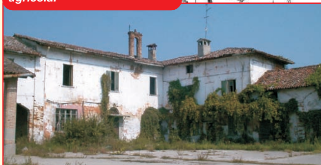
Cascina Brugnano è già presente nel XVI secolo, oggetto negli anni di un processo di adeguamento alle moderne necessità dell'attività agricola.