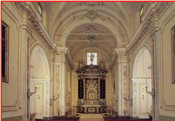
Il Santuario di Ariadello edificato nella seconda metà del XVII secolo, è ancora oggi oggetto di una sentita devozione mariana. Il luogo, già nominato nei secoli medievali come ad Riathellum, individua la modesta "riva" che distingue l'adiacente valle fluviale relitta, per secoli occupata dal colatore Morbasco.