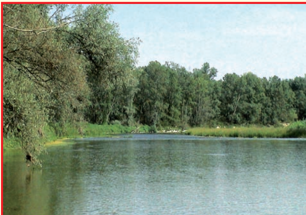
Il saliceto è la forma più evoluta di vegetazione legnosa che si può rinvenire in ambienti fluviali. Lungo la pista ciclabile delle città murate sono visibili alcuni tratti di questo tipo di bosco, insediati al piede della scarpata morfologica della Valle del Morbasco.