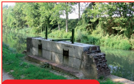
Bocche di presa lungo il Naviglio Civico delle rogge Conta e Sommasca.